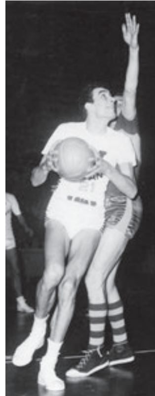
Un momento della partita