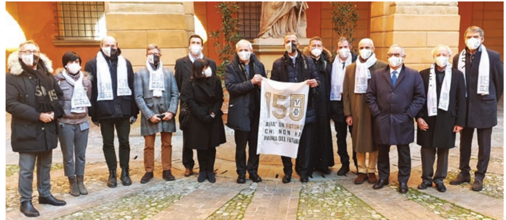
L'incontro tra la delegazione della Sef Virtus e il cardinale Matteo Zuppi. In basso da sinistra, Brunamonti con Bucci e Ondina Valla

Il 17 gennaio 1871 nasceva la società che ha attraversato la storia della città fino a oggi, regalando quattro ori olimpici, le leggende di Valla e Dordoni e l'epopea del grande basket